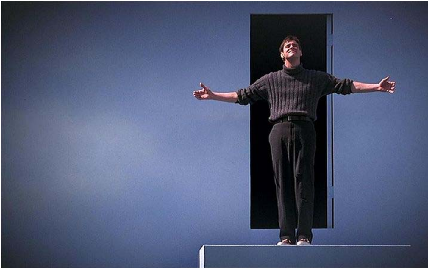
Truman Burbank, Jim Carrey, in "The Truman Show", saluta il suo pubblico virtuale ed esce di scena.